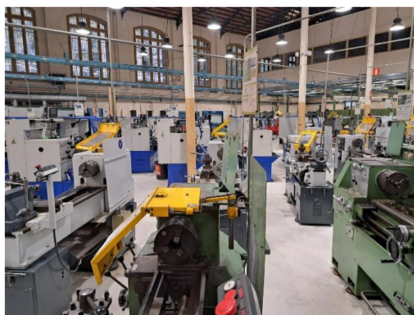
Park maszynowy w Escola del Treball