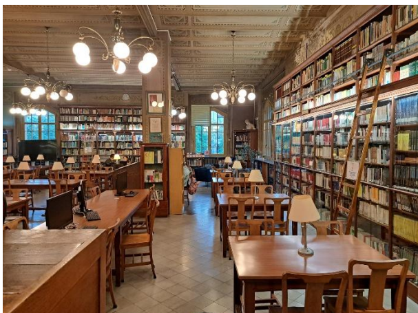
Biblioteka w Escola del Treball

Ciekawym doświadczeniem była również wizyta w Escola del Treball w Barcelonie , która kształci ponad 1600 uczniów. To szkoła z ponadstuletnią tradycją, mieszcząca się w kompleksie Escola Industrial, gdzie wcześniej funkcjonowała fabryka przemysłowa. Od 2022 roku posiada status krajowego centrum doskonałości w dziedzinie zautomatyzowanej produkcji w inteligentnym, nowoczesnym przemyśle, a obecnie szkoła prowadzi różnorodne formy kształcenia: programy zawodowe na poziomie średnim i wyższym, liceum, a także kursy przygotowawcze z dziedziny mechanik i automatyki.