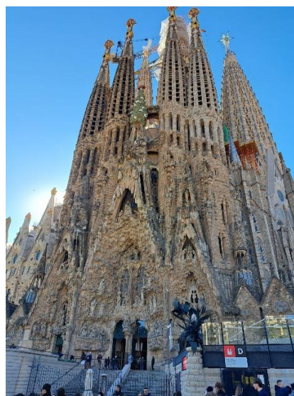
Bazylika Sagrada Familia autorstwa Antonio Gaudiego