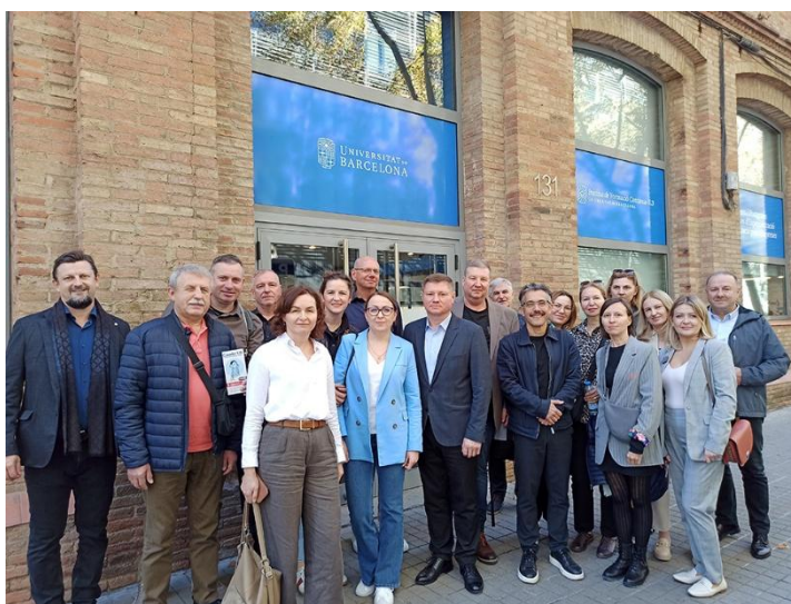
Członkowie WZK, Institut de Formació Contínua funkcjonujący przy Uniwersytecie w Barcelonie