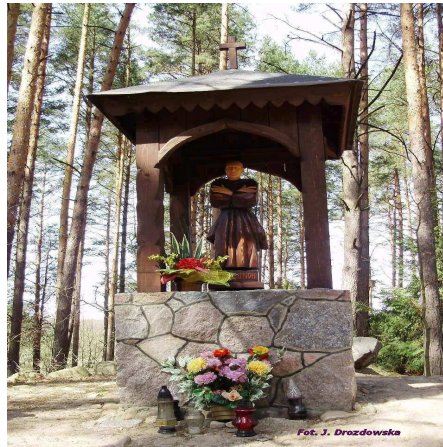
Kapliczka św. Brunona ze Śmierciowej Góry