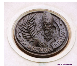
Tondo z płaskorzeźbą św. Brunona z Bazyliki NSJ w Augustowie