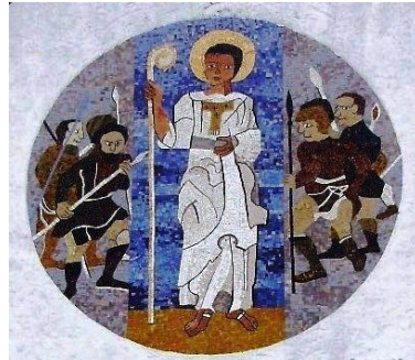
Mozaika ze szczytu frontonu kościoła pw. św. Brunona w Giżycku