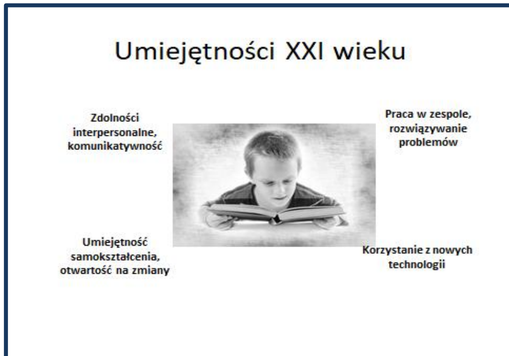
Schemat 2. Umiejętności XXI wieku – opracowanie własne

Pojawia się jednak pytanie: czy nauczyciele są przygotowani do pracy zespołowej? Czy posiadają wystarczające umiejętności? I wreszcie, czy w swojej pracy korzystają z dobrodziejstw pracy zespołowej? Patrząc na nauczyciela jako na profesjonalistę w swojej dziedzinie – na wszystkie pytania powinniśmy odpowiedzieć TAK! Nauczyciel stosujący te zasady w zespole nauczycielskim przeniesie je do pracy z uczniem i tym samym, poza przekazywaniem wiadomości, wyposaży swoich uczniów w bardzo istotne dziś kompetencje, co obrazuje poniższy schemat: